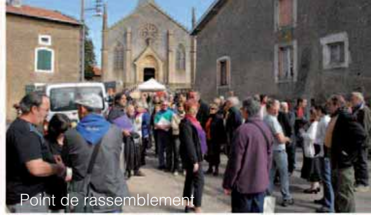
Point de rassemblement

Un programme riche qui a demandé un énorme travail de préparation et de coordination avec seul but : la satisfaction de tous !